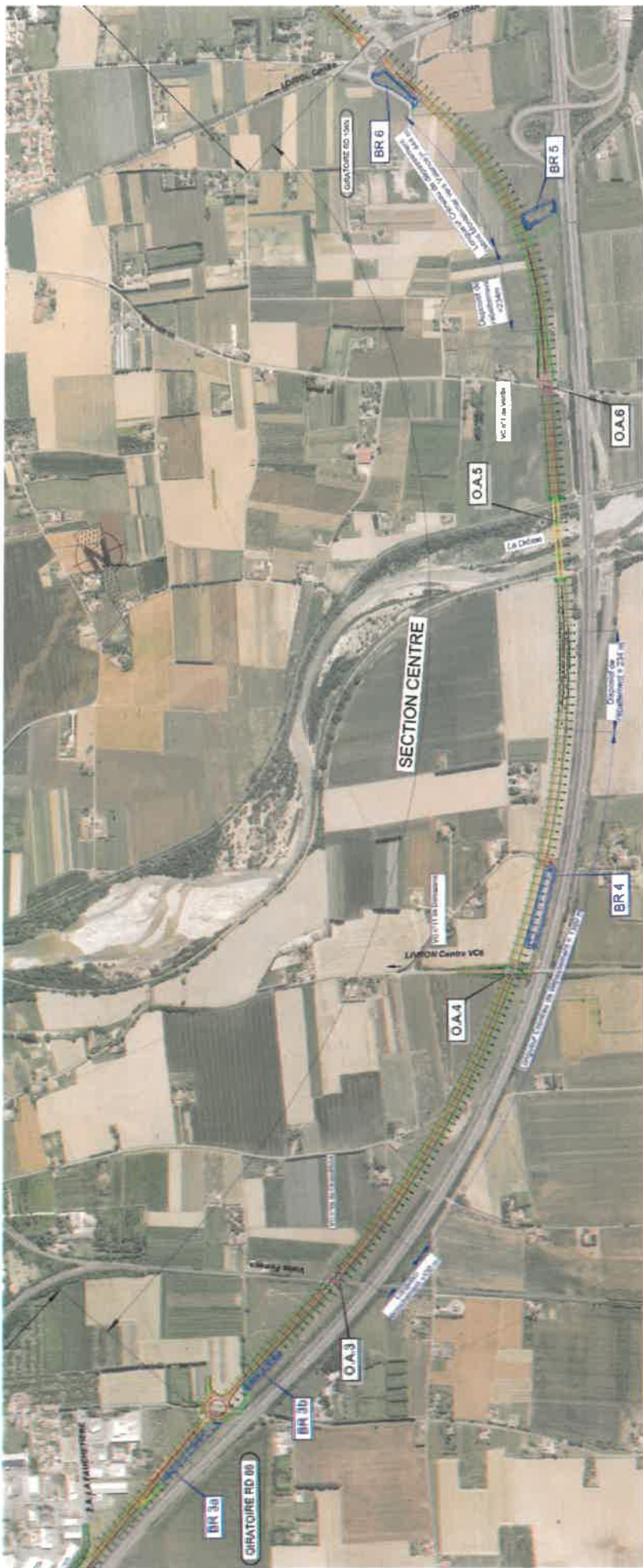
Plan synoptique du projet de déviation – Barreau Central