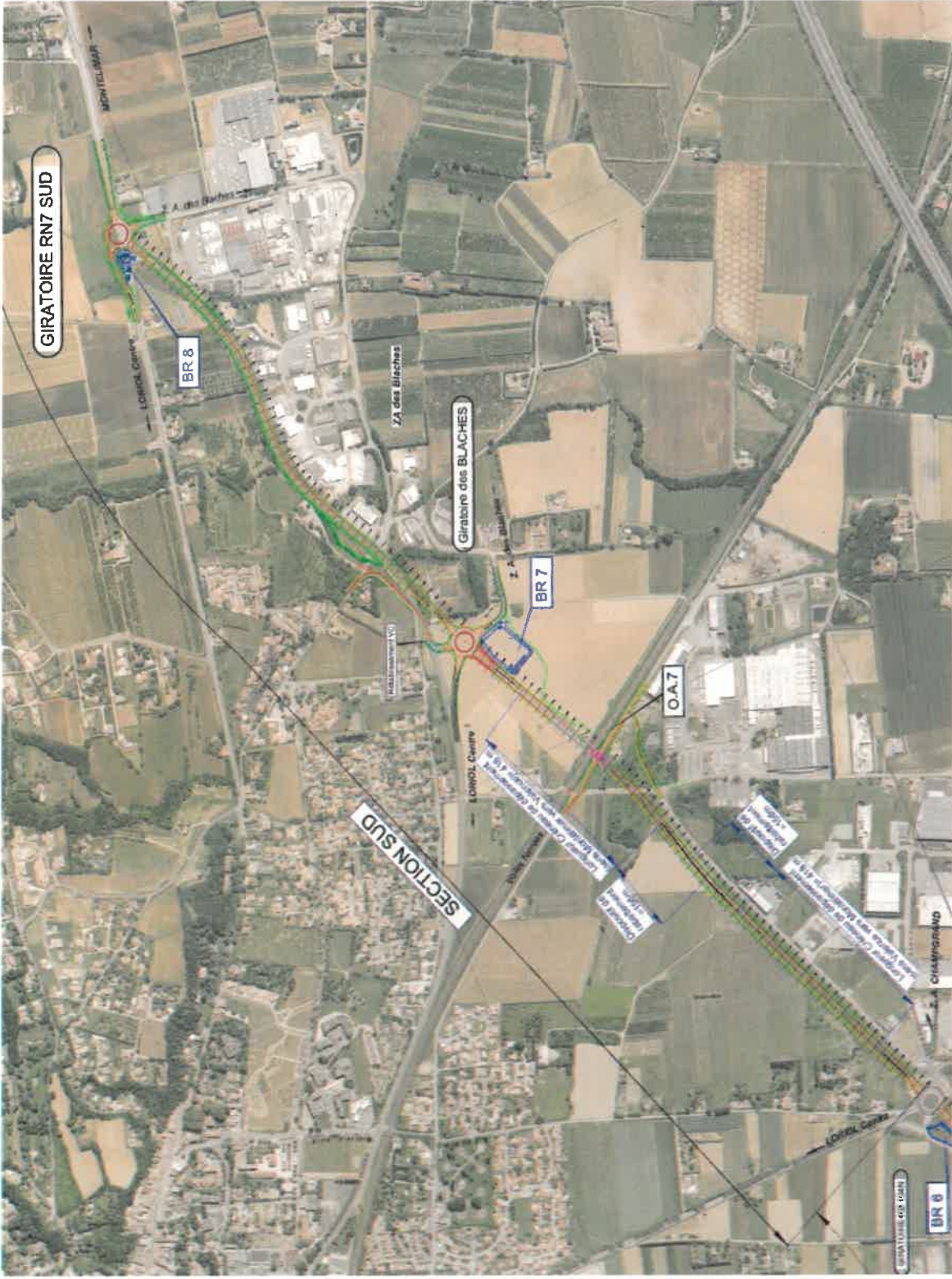
Plan synoptique du projet de déviation – Barreau Sud